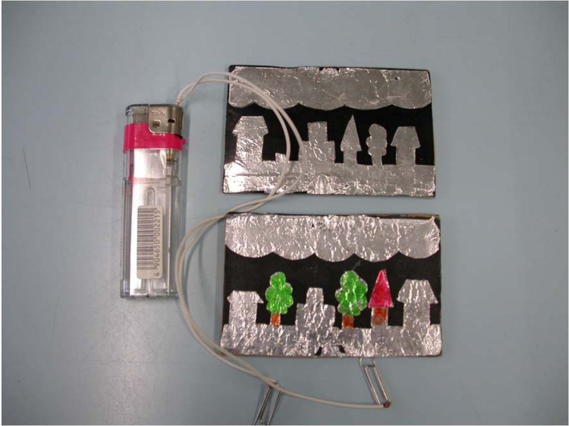
写真 4. 子供が作製した稲妻発生器。