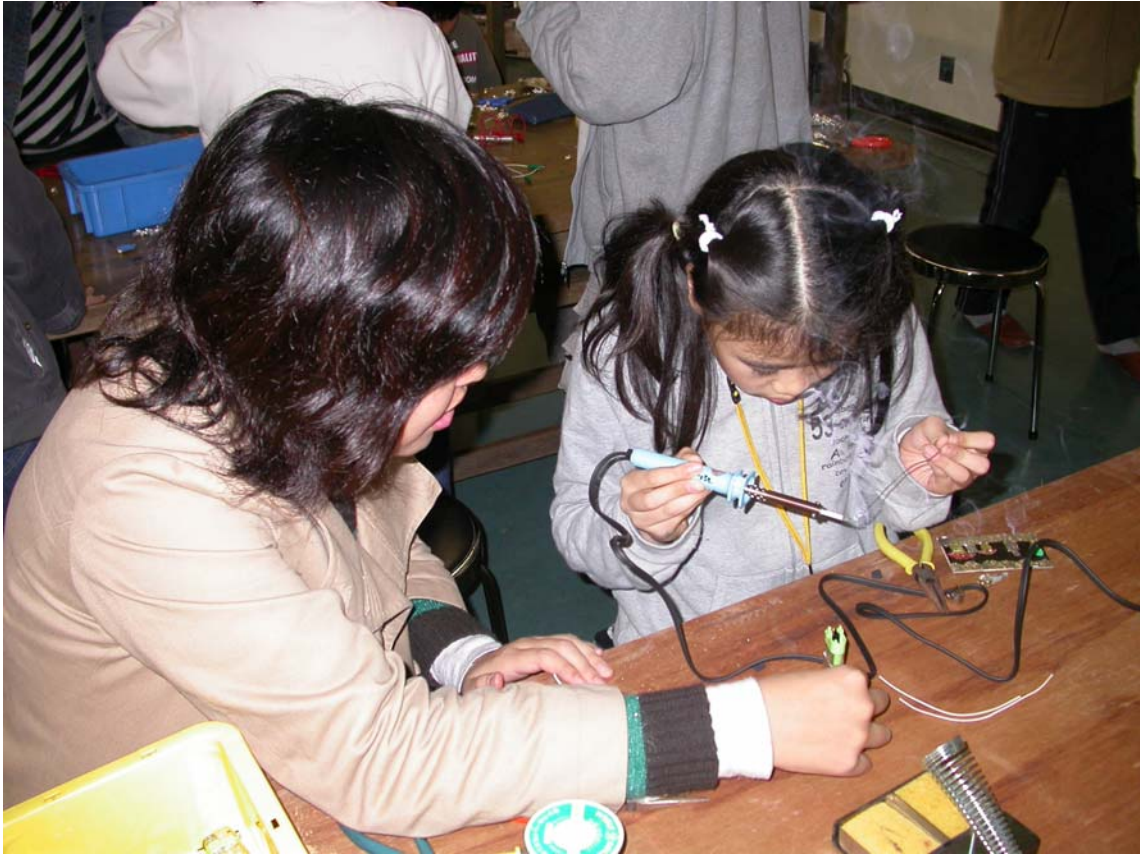
写真2. 学生スタッフが子供に半田付けの仕方を教えている場面。