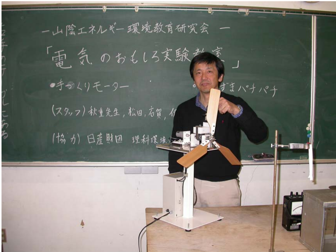
写真 1. 風力発電型電磁誘導実験装置「ウインディー」を用いての演示実験。